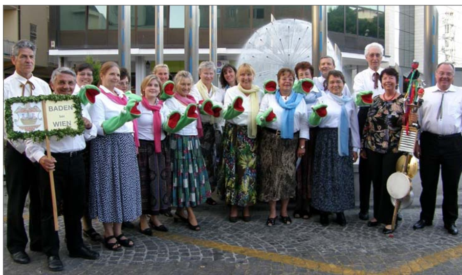
E-Chor Baden in San Marino

– für alle Beteiligten wieder ein unvergessliches Erlebnis!