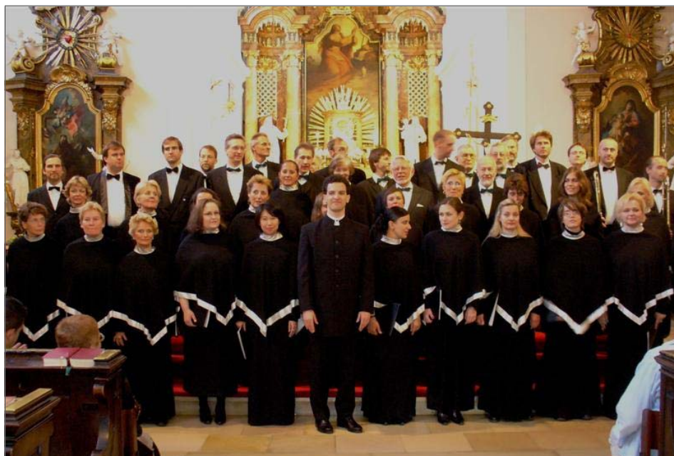
Der Wiener Madrigalchor in Maria Enzersdorf