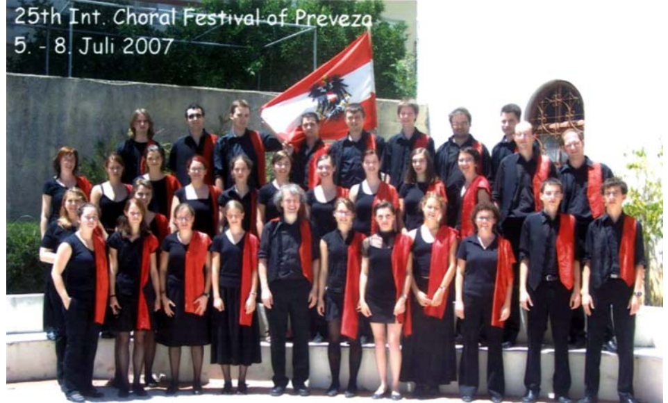
Der Hollabrunner Chor „Capella Cantabile“

Die endgültigen Ergebnisse erfuhren sie – wegen organisatorischer Mängel – erst auf der Busfahrt zum Flughafen Athen – umso größer waren Stolz und Freude: Noch lange nach dem Flug währte man sich in höhere Sphären entrückt.