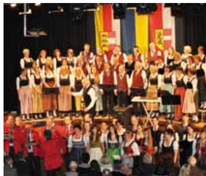
Der Singkreis St. Lorenzen lud anlässlich seines 35-jährigen Jubiläums zum vielumjubelten Chorabend ein.

Drei Chöre unterschiedlichster Art aus Kärnten, Salzburg und Niederösterreich beeindruckten durch ein äußerst abwechslungsreiches und temperamentvolles Programm. Das Publikum dankte es dem gemischten