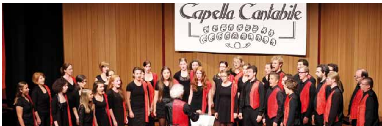
Capella Cantabile Hollabrunn lädt am 31. Mai anlässlich seines 30-Jahr-Jubiläums zum Festkonzert ein.