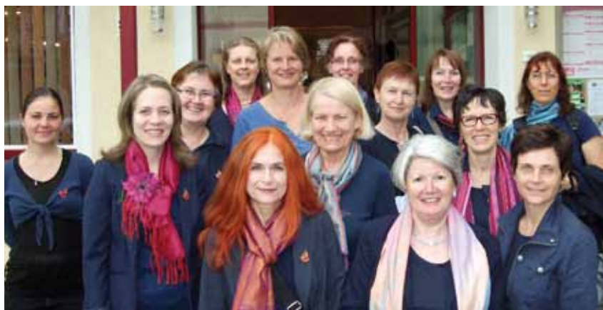
Singkreis Krems Viva la Musica bei „Feuer und Stimme“ in St. Michael im Lungau.

Das 20-jährige Bestehen feiern die Sängerinnen mit einer Chorreise in die Schweiz zum Pro Cantu Zürich, mit zwei Gemeinschaftskonzerten, zum einen mit dem Ensemble Vocal Vivace aus Luxemburg am 27.5., zum anderen mit dem Augsburgener Frauenchor Vox Female am 26.9. und mit einem Adventkonzert am 29.10. in Krems, zu welchem der Singkreis Krems Viva la Musica die Chöre des Sängerkreises Wachau als mitwirkende Gäste eingeladen hat. Man darf gespannt sein. ■