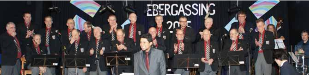
Der MGV Ebergassing sorgte mit seinem abwechslungsreichen Programm und Showeinlagen für Unterhaltung.